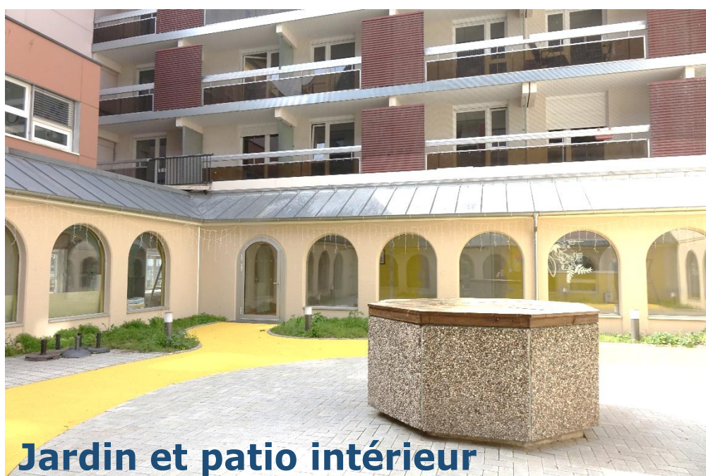
Jardin et patio intérieur

Les différents étages sont desservis par 3 ascenseurs.